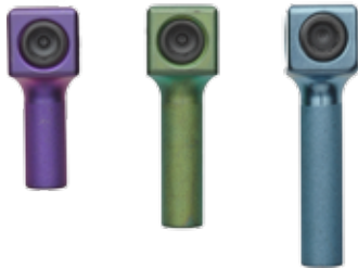
Conectores de Dompensação · 10 mm, 15 mm e 20 mm