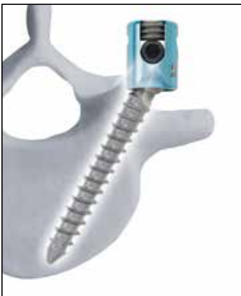
Os parafusos pediculares têm até 76° de variabilidade no plano axial