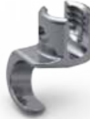
Ganchos de Compensação (offset) Laminares