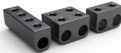
Conectores de Haste