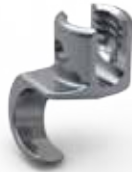
Ganchos de Compensação (offset)